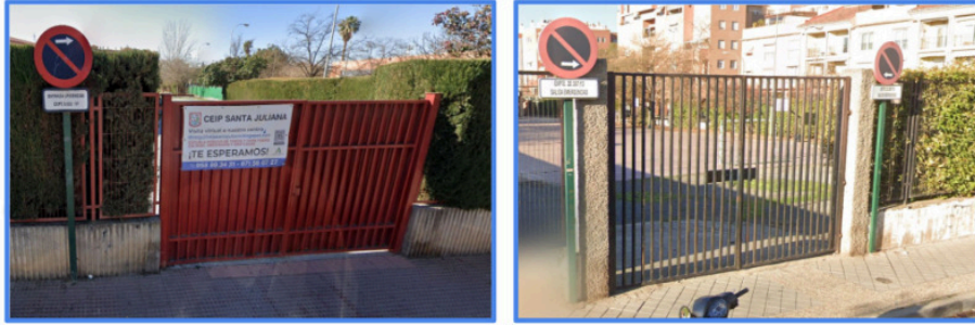
Anexo I. Ejemplos de centros que tienen concedida la salida de emergencias