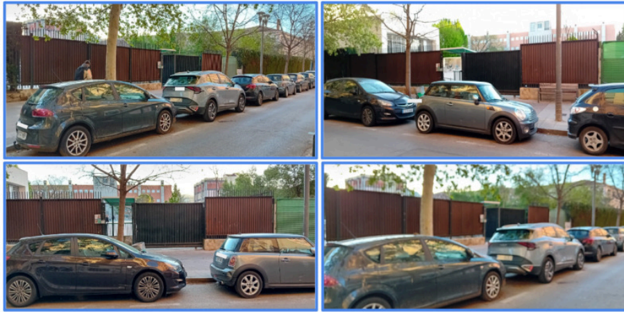
Anexo II. Estado actual de la entrada al centro